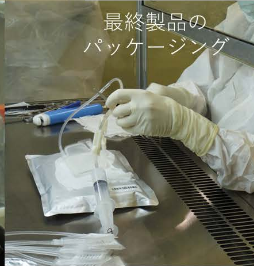
最終製品の パッケージング