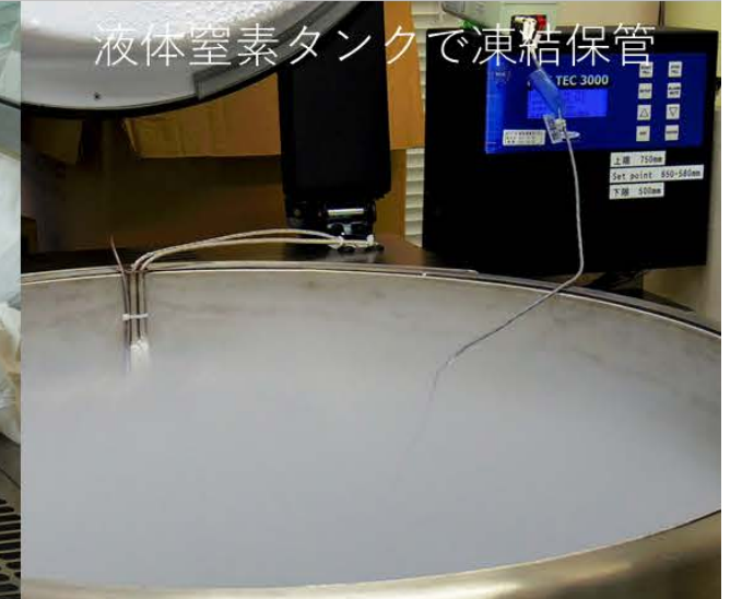
液体窒素タンクで凍結保管

臍帯血・臍帯バンク：臍帯血・臍帯由来細胞等を資源化し、臨床用の細胞治療や創薬等のソースとして、また研究用細胞等のソースとしての供給を目指しています。